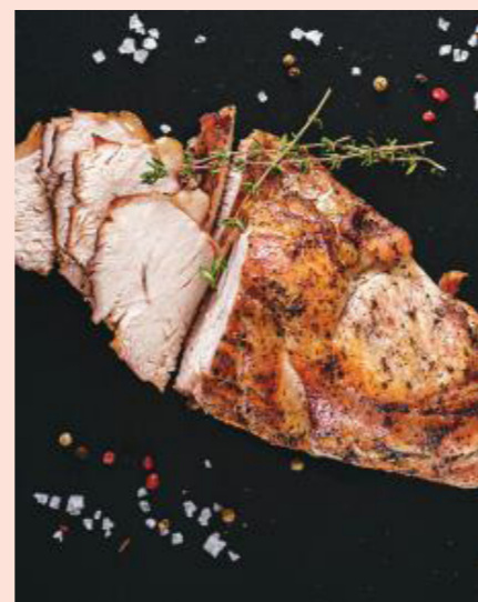
Kalkoengebraad - Rôti de dinde

Kant-en-klare specialiteiten om mee uit te pakken!