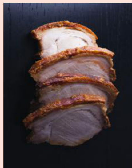
Varkensgebraad - Rôti de porc