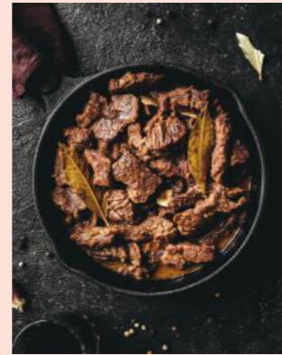
Rundstoofvlees Carbonnades de boeuf