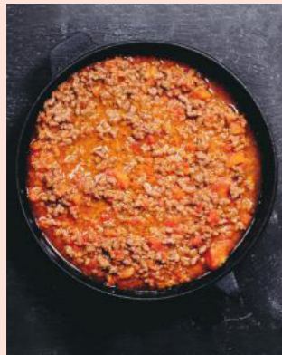
Sauce Bolognese Saus

Spécialités prêtes à l'emploi qui donnent envie!